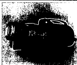
記念品 (LEDライト((H26年度))