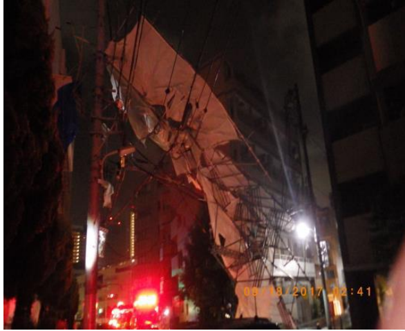
写真1 倒壊した足場の状況（消防隊現場到着時の状況）