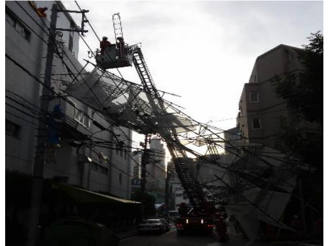
写真2 倒壊した足場の撤去作業状況