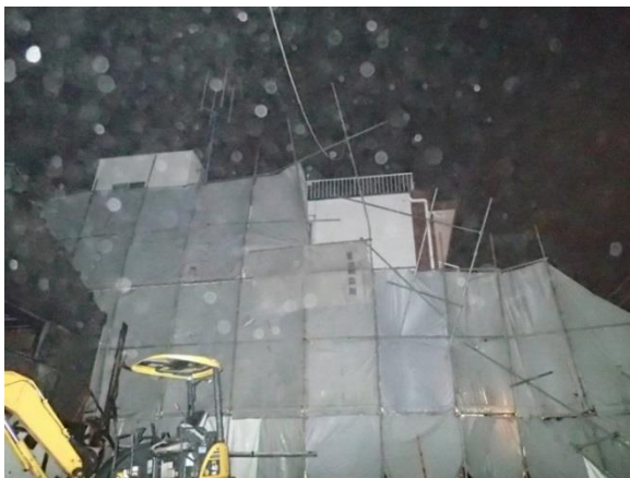
写真1 倒壊した足場の状況