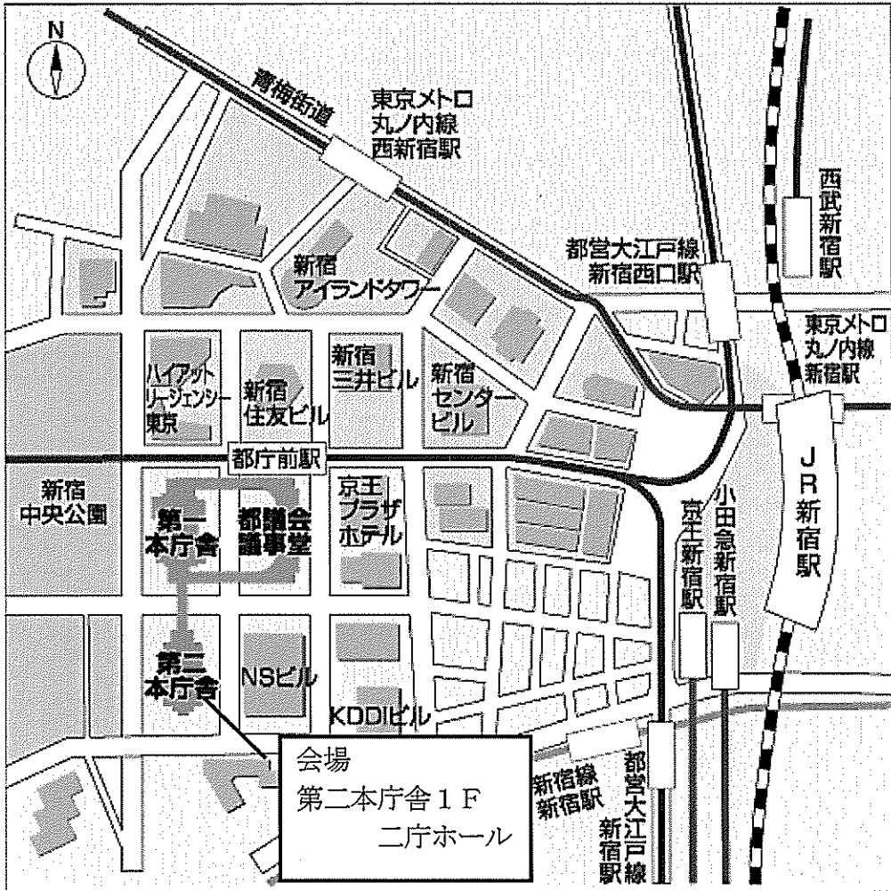
第二本庁舎 1 階案内