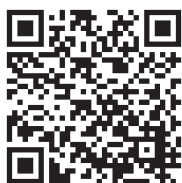
申込フォームQRコード