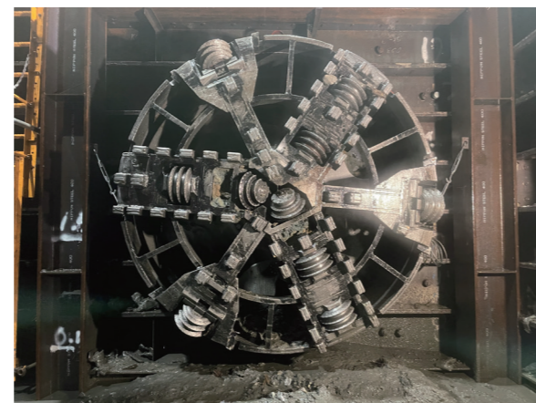
【作品名】推進機貫通