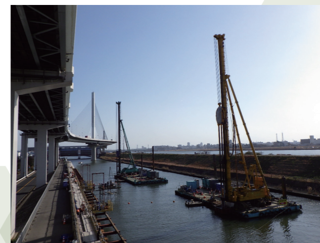
【作品名】地震から住民の生活を守るために