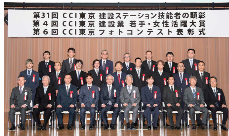
第31回 建設ステーション技能者の顕彰 優秀技能者 記念撮影