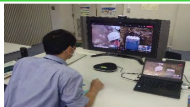
技術者が、カメラ映像を確認し、現場へ指示