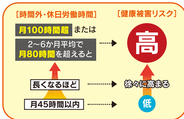
過重労働と健康リスクとの関連性

(右の図は、労災補償に係る脳・心臓疾患の労災認定基準の考え方の基礎となった医学的検討結果を踏まえたものです。)